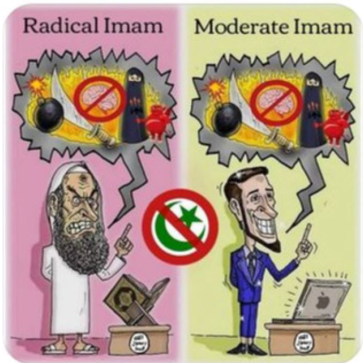
Bilde 12: Skjermdump fra Ex-Muslims of Norway

hvor hensikten er at leseren skal sammenlikne de to. Tegningen til venstre viser en mann kledd i klær forbundet med islam, nærmere bestemt en lang, hvit kaftan, en hvit bønnelue og hvite sandaler. Han har krøllete fullskjegg og et veldig sint ansiktsuttrykk. Han står foran en pdestall med en bok på som lett kan tolkes til å se ut som en koran. Mannen løfter den venstre pekefingeren i været. Over mannen er det en snakkeboble som inneholder tegninger av fem symboler: en påtent bombe, en sabel, en hjerne med