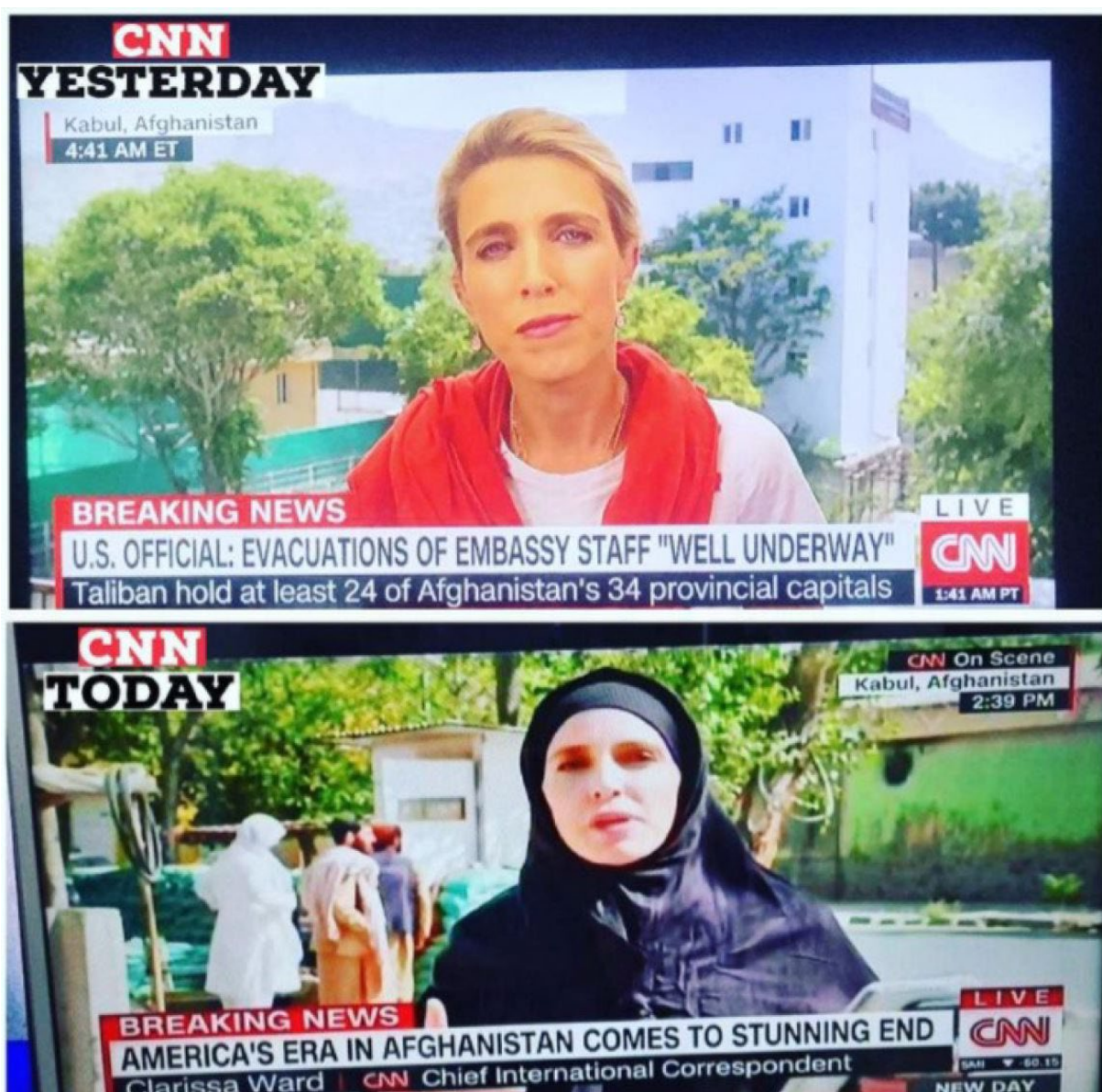
Bilde 7: Skjermdump fra Ex-Muslims of Norway

I etterkant av terrorangrepet på World Trade Center 11. september 2001 hadde USA hatt militærstyrker på bakken i Afghanistan. I de to siste amerikanske presidentvalgene, 2016 og 2020, var krigen i Afghanistan på agendaen. Det resulterte i at president Donald Trump inngikk en avtale med Taliban for å trekke de amerikanske styrkene fra landet (Mathur, 2021). Til slutt var det Trumps etterfølger, Joe Bidens oppgave å gjennomføre tilbaketrekningen. 30. august 2021, var datoen USA offisielt trakk seg ut av Afghanistan, og resultatet ble at hovedstaden var under Talibans kontroll kort tid etterpå (Shear & Tankersley, 2021).