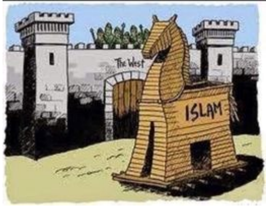
Bilde 11: skjermdump fra Ex-Muslims of Norway

etterpå. I svaret på denne kommentaren er det en annen aktør som har publisert en tegning. På bildet er det tegnet en hest laget av tre, som er plassert ved en bymur som er på høyde med hesten. Altså, et bilde på en trojansk hest. På hesten står det skrevet «islam» og på muren står det skrevet «The West». Dette skaper forskjellighet mellom «islam» og «Vesten», på samme måte som den første kommentaren som skaper et skille mellom «Europa»