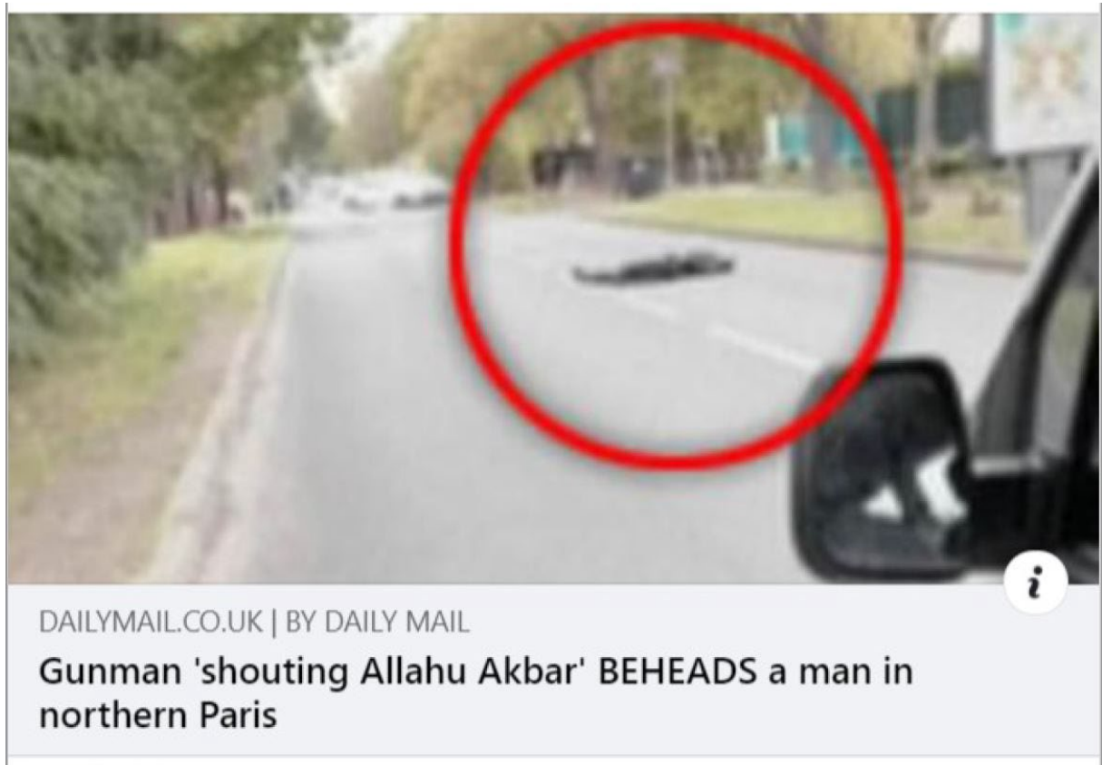
Bilde 4:

Bildet som er knyttet til innlegget, som kommer med fordi innlegget deler en nyhetssak, er av en person som ligger rett ut midt i en gate. Det er nærliggende å tenke at denne personen er død.