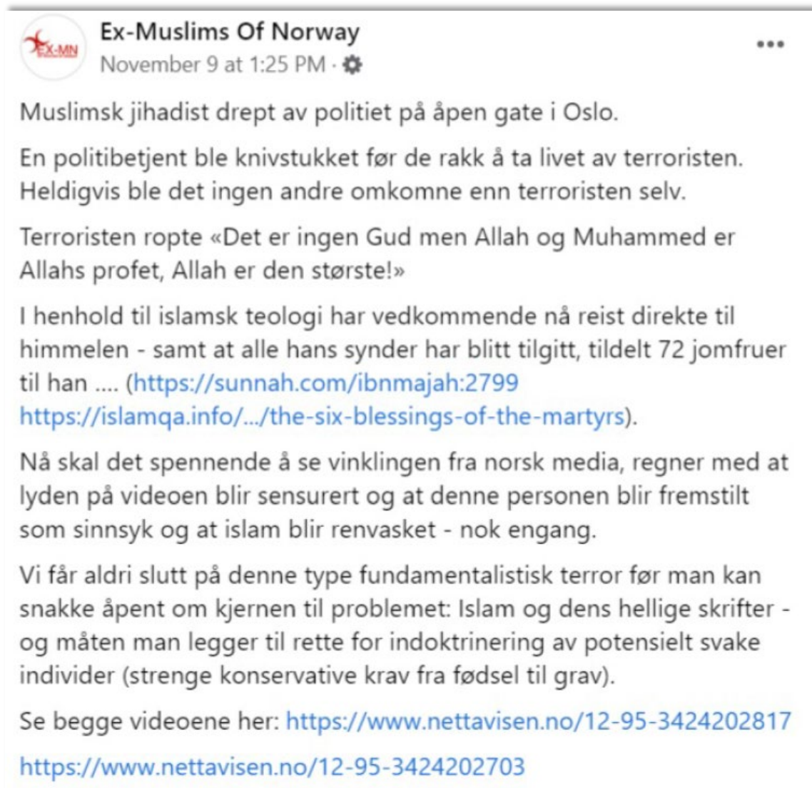
Bilde 9: Skjermdump fra Ex-Muslims of Norway

Den 9. november 2021 kom nyheten om at en mann ble skutt og drept på Bislett av politiet. Mannen skal ha løpt etter en kvinne med kniv. Da politiet ankom stedet prøvde de først å kjøre ham ned før han til slutt ble skutt av en av politibetjentene. En politibetjent ble skadet under hendelsen (NRK, 2021). Hele hendelsen er fanget på forskjellige mobilkameraer, og disse filmene og bildene har blitt publisert i norske medier. En artikkel fra Aftenposten angående hendelsen ble publisert klokken 09.22 om morgenen den 9. november. Innlegget er publisert av Ex-Muslims of Norway samme dag som hendelsen (Rønneberg et al., 2021). Innlegget består