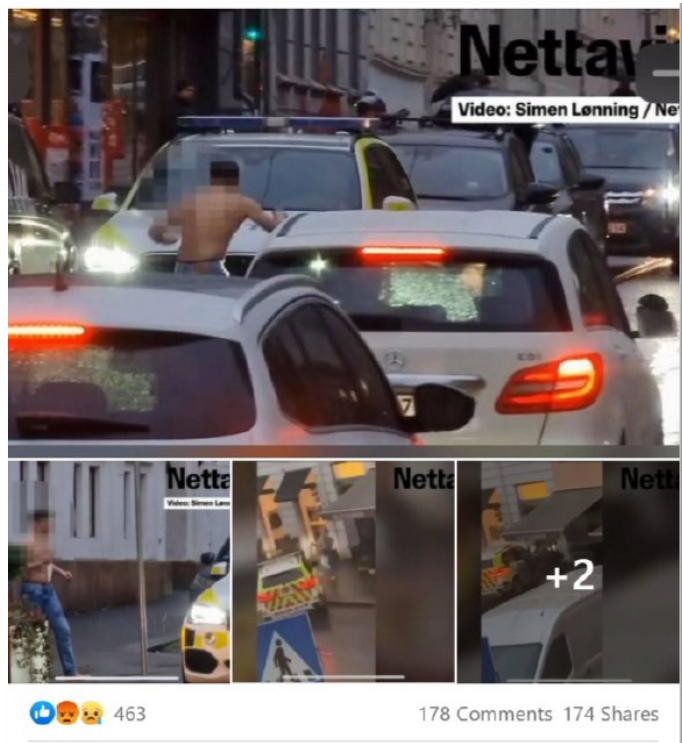
Bilde 10: Skjermdump fra Ex-Muslims of Norway

I det syvende og siste avsnittet i dette innlegget fungerer teksten som bevisførsel av hendelsen ved å dele en lenke til Nettavisen der det er mulig å se to videoer av hendelsen. Disse videoene er som tidligere nevnt ikke en del av datamaterialet, da oppgavens omfang ikke gjør det mulig med en analyse av dette også. Under teksten er det delt seks bilder hvilke ser ut som er skjermdumper fra videoene som er delt. Noen bilder av en sensurert mann i bar overkropp og olabukse som holder en kniv, i nærheten av en politibil. Disse bildene er med på å illustrere teksten, men på grunn av oppgavens omfang er det ikke mulig å analysere hvert bilde hver for seg.