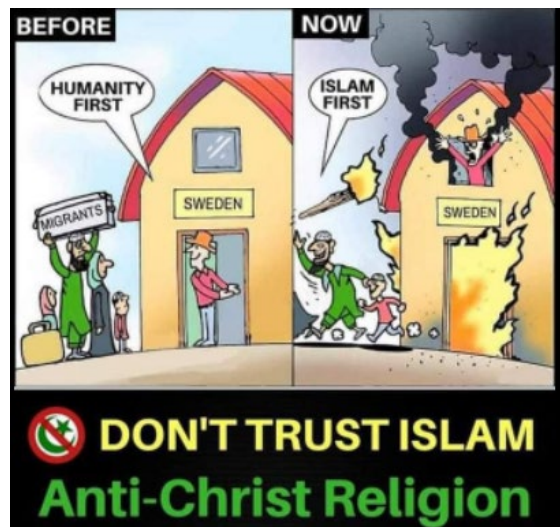
Bilde 13: Skjermdump fra Ex-Muslims of Norway

Et tydelig eksempel på hva en aktør mener med dette kommer som en kommentar i form av en tegning. Først, en analyse av tegningen. Dette er, i likhet med tegningen som ble analysert i kapittel 6.1.3, to tegninger plassert ved siden av hverandre med en hensikt å vise likheter og forskjeller. I tegningen til venstre står det skrevet «før», som i den gang da, og på tegningen til høyre står det skrevet «nå». Begge tegningene inneholder de samme elementene: en muslimsk familie som kjennetegnes av en mann med fullskjegg og