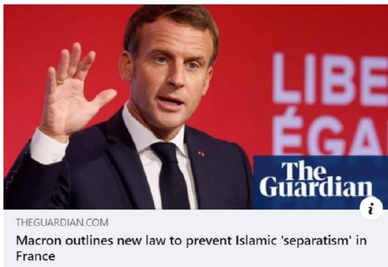
Bilde 2: Skjermdump fra Ex-Muslims of Norway

Det første avsnittet i teksten publisert av Ex-Muslims of Norway starter med en beskrivelse av den franske presidenten Emmanuel Macron som har kunngjort en ny lov mot religiøs separatisme, hvis mål er å frigjøre islam i Frankrike fra utenlandsk påvirkning. Teksten er skrevet med anførselstegn rundt «separatisme» og «utenlandsk påvirkning» som indikerer at dette er sitater fra nyhetssaken. I dette avsnittet skapes det ekvivalens mellom «fransk islam» og «utenlandsk påvirkning», samtidig som det uttrykkes et ønske om at disse to skal skilles. Med denne ordbruken er det det utenlandske som settes i tvil, og det blir nærliggende å tolke det i retning av at påvirkning fra utlandet er noe negativt som må stoppes. Dette gjør at «fransk» fra «fransk islam» og «utenlandsk» får et antagonistisk forhold. Hvordan denne påvirkningen skal stoppes, sier ikke innlegget noe om. En leser kan da velge å tolke «utenlandsk påvirkning» som innvandring, eller utenlandsk støtte til muslimske organisasjoner etc. Dette gjør «utenlandsk påvirkning» til en flytende betegnelse. Nyhetssakens overskrift viser til lovforslaget rettet mot islamsk separatisme, som også forfatteren påpeker i det første avsnittet.