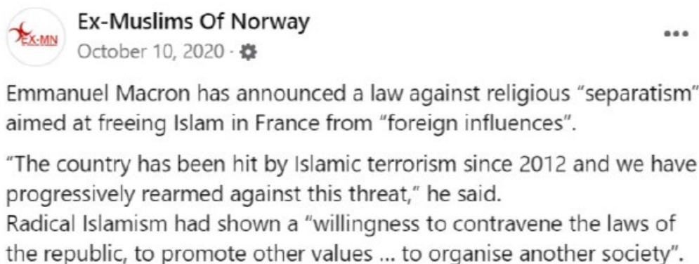
Bilde 1: Skjermdump fra Ex-Muslims of Norway

Innlegget som omhandler en ny separatismelov i Frankrike ble publisert i forkant av avstemningen i det franske senatet om en ny lov om ekstern religiøs påvirkning, og begrensning av isolering av religiøse grupper. Denne loven hadde blant annet som mål å bekjempe islamistisk separatisme i Frankrike. Loven vil komme til å påvirke blant annet hvordan man kan omtale offentlige ansatte på internett, tilbakekalling av offentlige midler hvis organisasjoner bryter med loven, regulering av hjemmeskole for franske barn, bøter til leger som utsteder jomfrusertifikat, altså dokumentasjon på at en ung kvinne ikke har hatt samleie (VG, 2009), og juridisk regulering av hvordan utenlandske midler kan støtte religiøse organisasjoner (Yeung, 2021). Innlegget som er publisert består av en tekst av Ex-Muslims of Norway og en lenke til en nyhetssak fra The Guardian som består både av et bilde og en overskrift. Teksten som er publisert sier følgende.