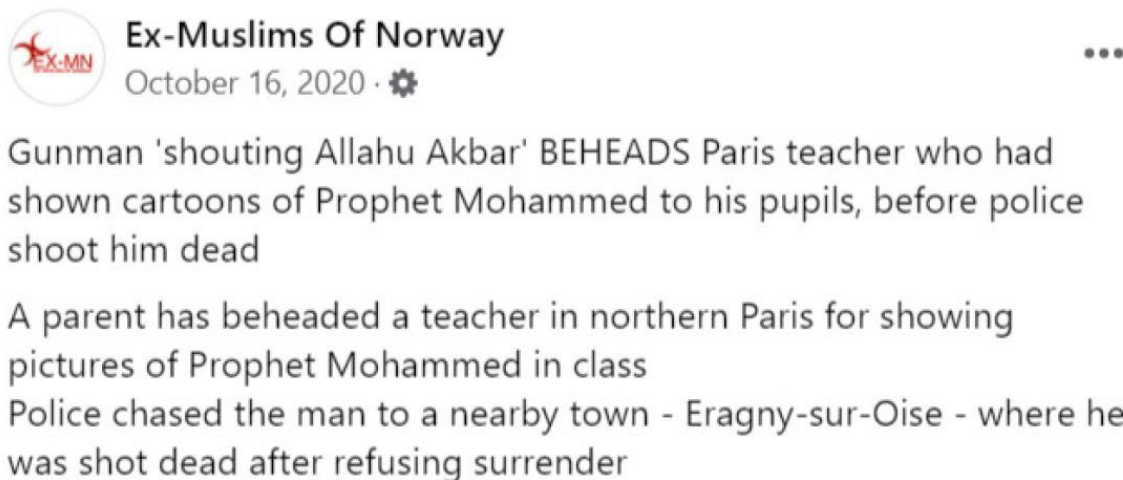
Bilde 3: Skjermdump fra Ex-Muslims of Norway

Den andre kritiske hendelsen i dette datamaterialet blir publisert i forbindelse med drapet på den franske læreren Samuel Paty, 16. oktober 2020. Paty ble halshugget på åpen gate av en 18 år gammel russisk mann med tsjetsjensk opprinnelse (Holmes et al., 2020). Det er publisert to innlegg i forbindelse med denne hendelsen av Ex-Muslims of Norway på facebookside. Det første innlegget ble publisert kort tid etter at hendelsen hadde funnet sted. Innlegget, i likhet med innlegget som ble analysert i delkapitlet over, består av en tekst og en deling av en avisartikkel. I dette innlegget kommer artikkelen fra den britiske avisen The Daily Mail , en av de største løssalgavisene i Storbritannia (Murray, 2020).