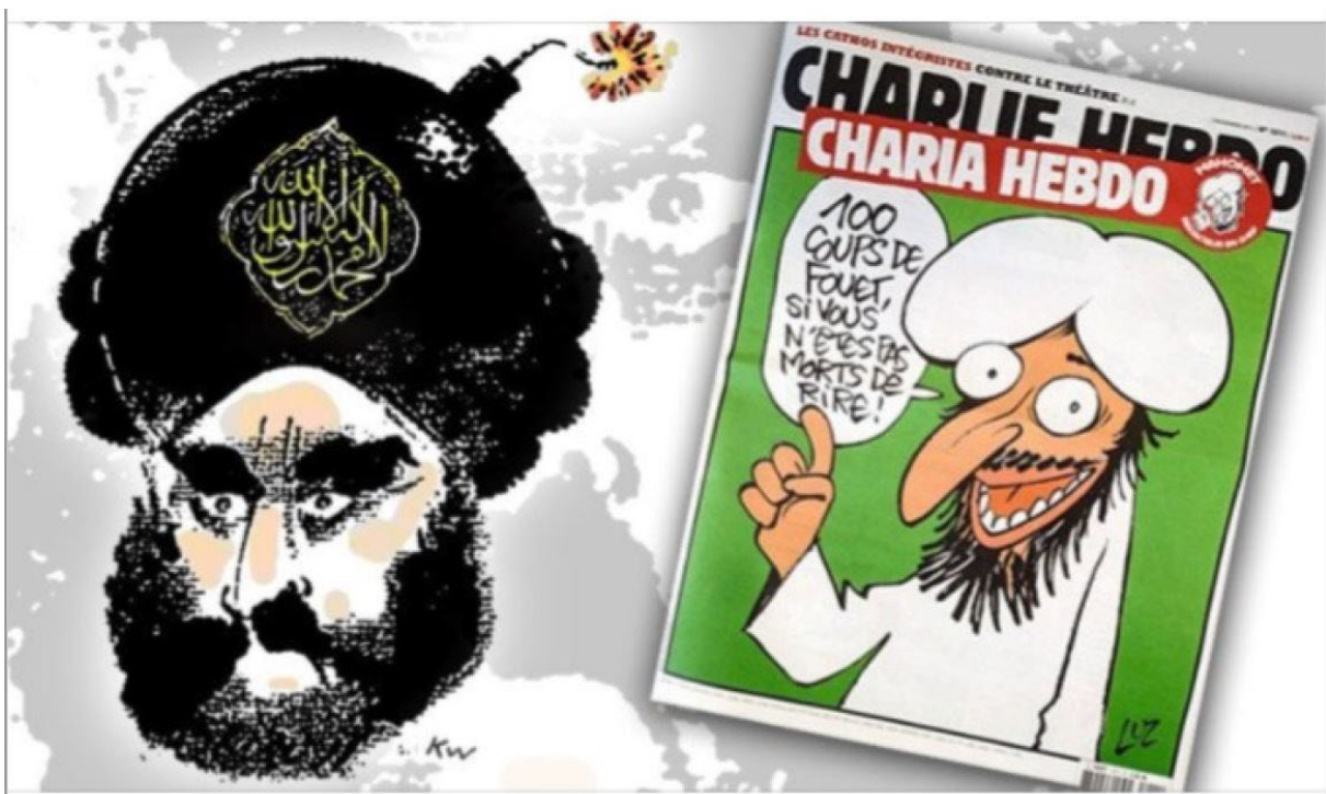
Bilde 5: Skjermdump fra Ex-Muslims of Norway

I det andre innlegget som ble publisert av Ex-Muslims of Norway i forbindelse med drapet på Samuel Paty, deles ikke en lenke til en nyhetssak, men kun et bilde sammen med en tekst. Bildet er det første man ser, så det ønsker jeg å analysere først. Bildet som følger trykkes for å kunne gjøre en visuell analyse. Det er omtalt i metodekapitlet hvorfor dette er valgt.