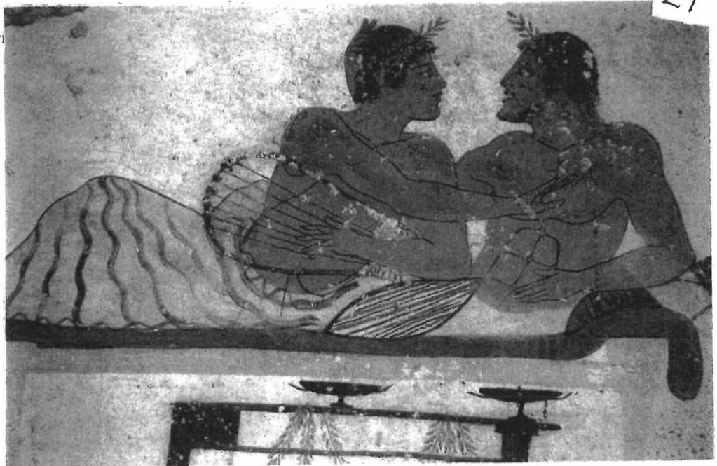
Bearded man and his youthful lover: banquet scene from the Tomb of the Diver (5th century BC).

«Symposion»-scene fra veggmaleri i en grav i Paestum, Sør-Italia. (Se ovenfor side 2.)