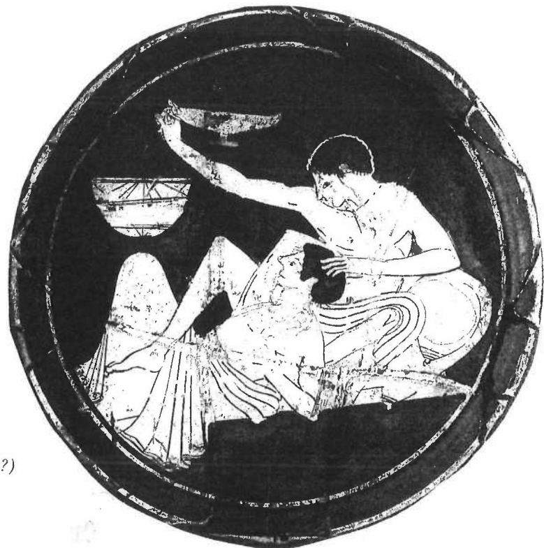
To ungdommer ved et symposium. Attisk rød-figur-illustrasjon (400-t. f.Kr.?)