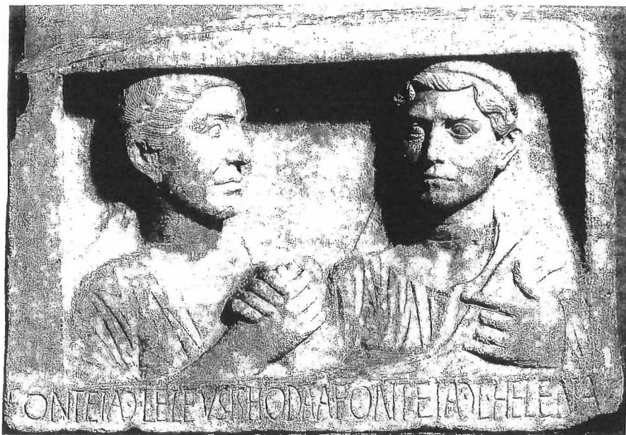
Fig. 7. Augustan funerary relief of two women with their right hands clasped in the classic gesture of ancient Roman married couples. 27 BCE–14 CE. British Museum Sculpture 2276.

Illustrasjon fra Bernadette Brootens bok "Love between women; Early Christian Responses to Female Homoeroticism". Se ovenfor, side 7.