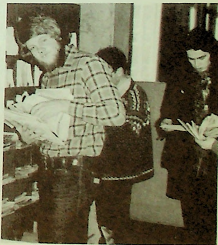
Post til meg i dag, tro?