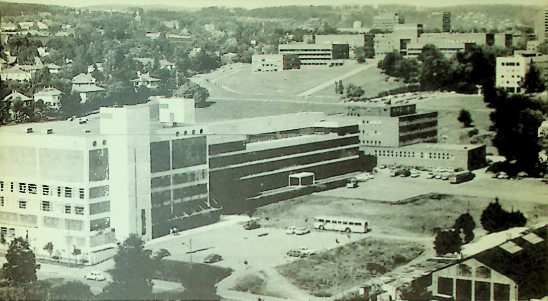
Bilde fra Majorstua med Menighetsfakultetet i midten. Vei-forklaring: se baksiden.