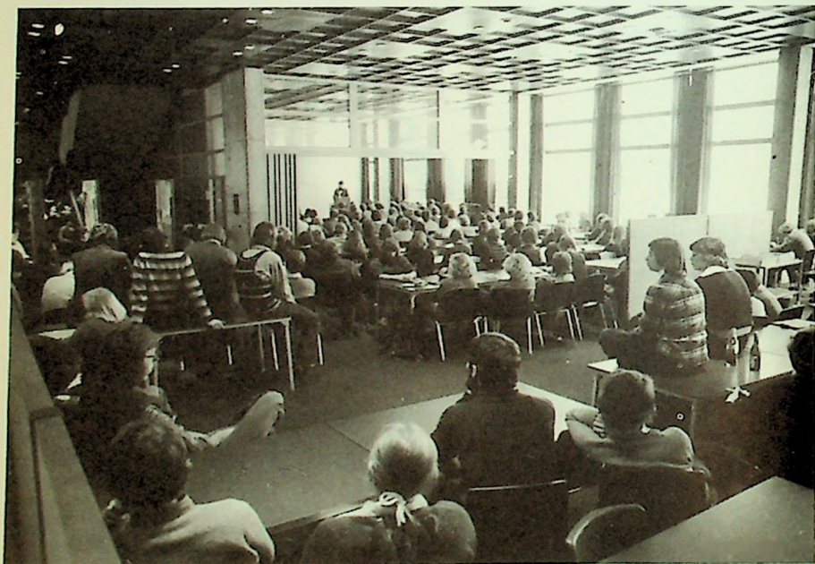
Kl. 10 hver dag har vi felles andakt – og alle sittemuligheter tas i bruk –.