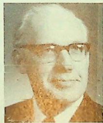
Njarne O. Weider Njarne O. Weider biskop