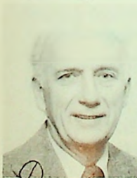
Erling Utne Erling Utne biskop