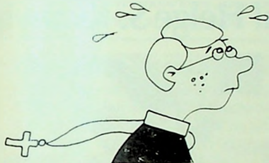
Sokneprest Liturgsen. Tegning: Stein Arne Hove.

På spørsmål om hva som var mest interessant ved antologien, svarer redaktøren: «Den er interessant fordi den viser noe av hva studentene er opptatt av.» -