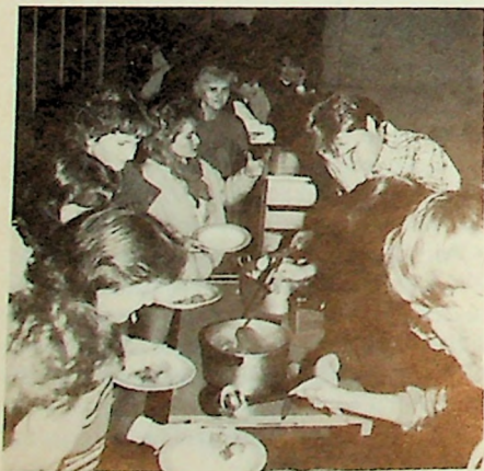
Det ble lang kø da 80 mennesker ville ha kinesisk middag i kantinen på MF. Tre forskjellige retter med ris ble servert.