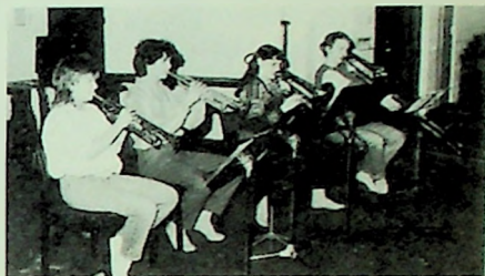
Øvelse med liv og lyst