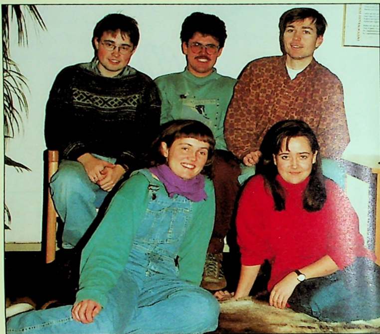
Gruppen som skal til Alta.