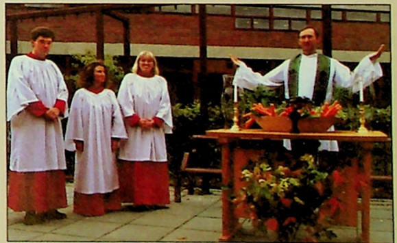
Fra en utegudstjeneste ved MF.

Prestene på sin side vil få økt innsikt i katekettikk. Grunnutdanningen i pastoral teologi vil for prestenes del bli mindre presteorientert, d.v.s mer