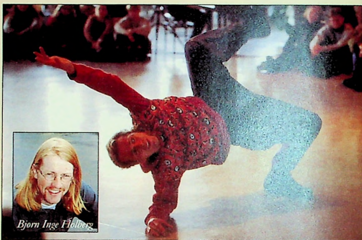
Et reisende teater framførte forestillingen «Rop etter heim» under miljøtiden.

Miljøtimene spenner over et vidt spekter av emner. Den ene onsdagen er det teater, den neste uken kan det være misjonsuke. Timene har flere siktemål. De skal underholde, de skal provosere, de skal knytte sammen. Ikke alt hver gang, noen ganger