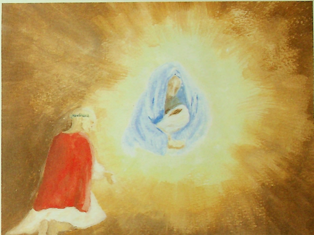
Keiseren ser...en blåkledd kvinne. Og et barn som gjør Caesars legioner intet verd.

Mot slutten av sitt liv deponerer Augustus hos vestalinnene i Roma et dokument som kalles Res Gestae , og som er en selvhyllest hvor alle hans velgjerninger og seire nevnes. Ved hans død ble dokumentet lest opp i senatet og tavler med innskriften ble satt opp rundt om i riket. En av disse tavler er funnet. Her skriver han i stolthet blant annet dette: "Våre forfedre har bestemt at Janusporten skal stenges når fred i hele riket er sikret både til lands og til sjø. Før min tid hadde det skjedd at porten ble lukket bare to ganger. Under min regjering har senatet hele tre ganger besluttet at Janusporten skal lukkes". Den aldrende keiser skryter av seg selv som den store fredsbygger. Det var den stengte Janusporten på Forum et tegn på. I Roma finnes fortsatt Augustus' store fredsalter (Ara Pacis) som en påminnelse om