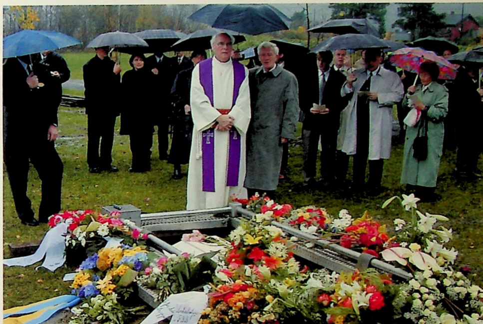
Fra begravelsen på Grefsen kirkegård.