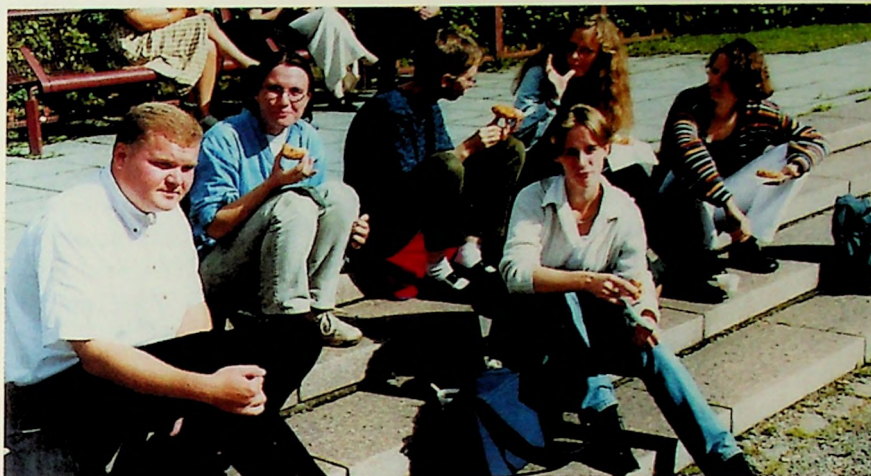
Kirken trenger flere av disse - studenter som ved endt utdanning vil gå inn i kirkelig tjeneste.