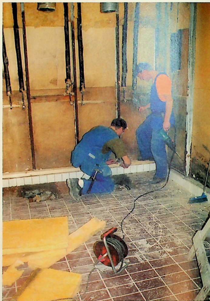
Her skal det bli helt nytt dusjanlegg.

Trolig vil dette være avklart en gang ut på vinteren. Så skal det gjøres avtaler med håndverkere før man kan gå i gang forhåpentligvis på forsommeren en gang. Det er også behov for utskiftninger i fasaden av bygget. For eksempel er en del vinduer mørkne og deler av teglsteinen i fasaden bør skiftes ut. Ventilasjonsanlegget er også moden for en oppgradering. Slike ting ønsker vi å utbedre i etapper, forteller kontorsjefen.