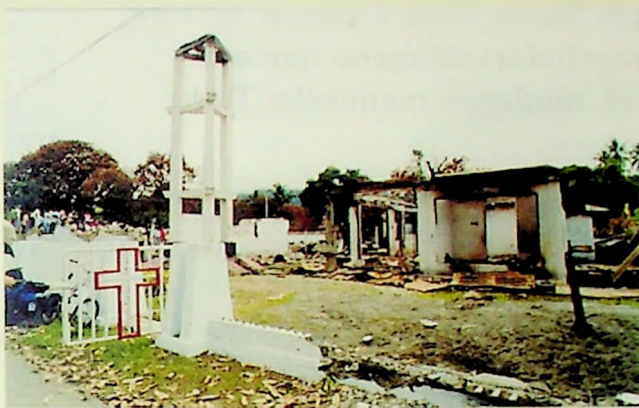
En rasert kirke i Indonesia får stå som symbolet på at det kan koste å holde fast ved troen på Kristus.

Dette er et utsagn som virkelig krever frimodighet! I dag er