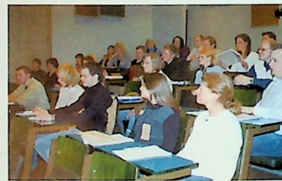
De første med pentekostale studier ved MF.