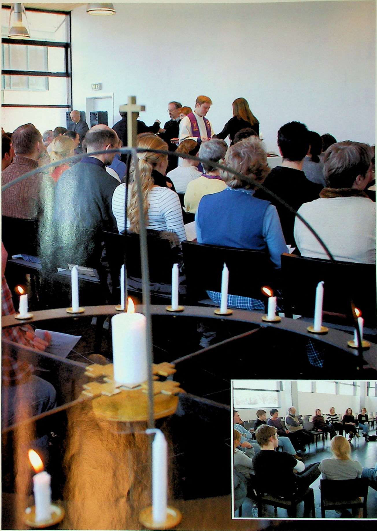
Det nye MF-kapellet brukes til både andakt, gudstjenester, lovsang, nattverd og forbønn.