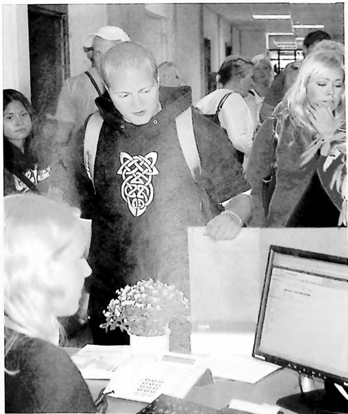
Pågangeren til studieadministrasjonen er stor de første dagene av semesterstarten.