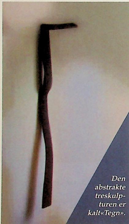
Den abstrakte treskulpturen er kalt «Tegn».