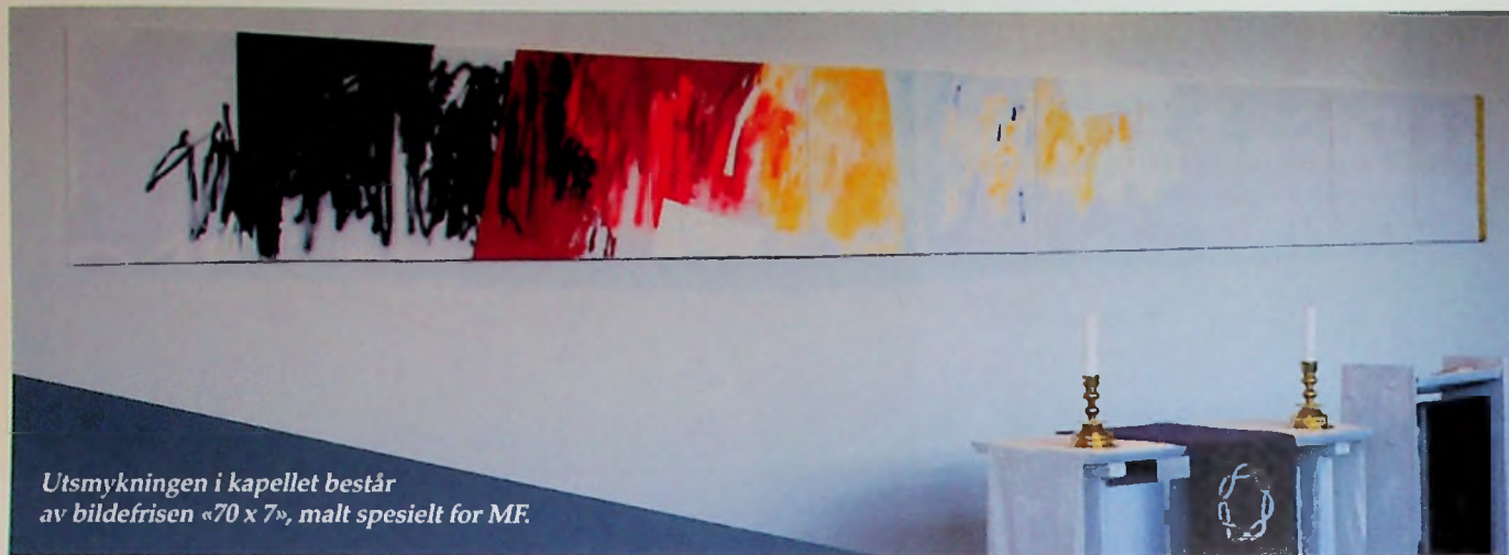
Utsmykningen i kapellet består av bildefrisen «70 x 7», malt spesielt for MF.