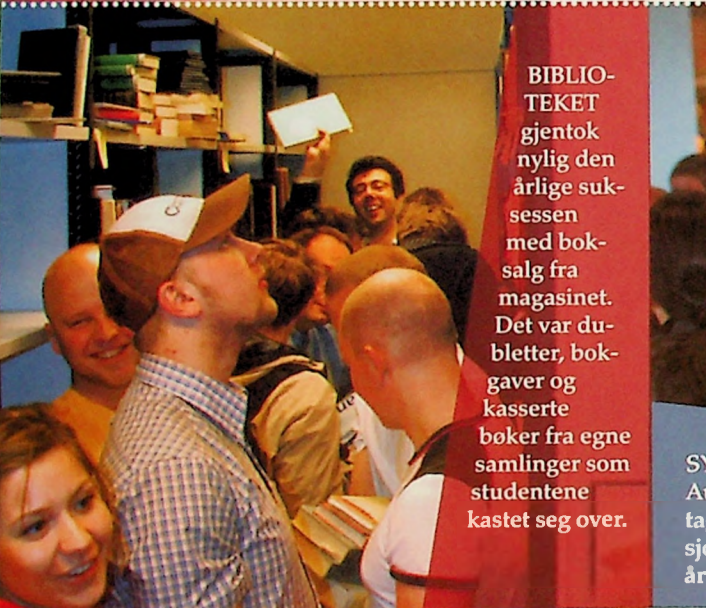
BIBLIOTEKET gjentok nylig den årlige suksessen med boksalg fra magasinet. Det var dubletter, bokgaver og kasserte bøker fra egne samlinger som studentene kastet seg over.