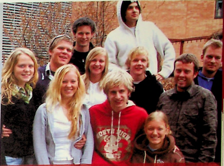
EN GRUPPE elever fra Bibelskolen i Grimstad besøkte MF i april. Her ble det orientering om studietilbud, omvisning, brus og boller