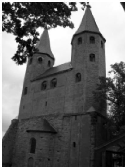
Klosterkirken i det tidligere benediktinerinne-klosteret Drübeck.

Temaet for årets konferanse var ”Guds funksjonshemmede bilde” og tok for seg forholdet mellom gudbilledligheten som beskrives i