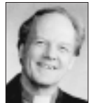
ØYSTEIN I. LARSEN Biskop

Matt 4: NOS 113; Matt 16: NOS 128; Matt 26: NOS 130