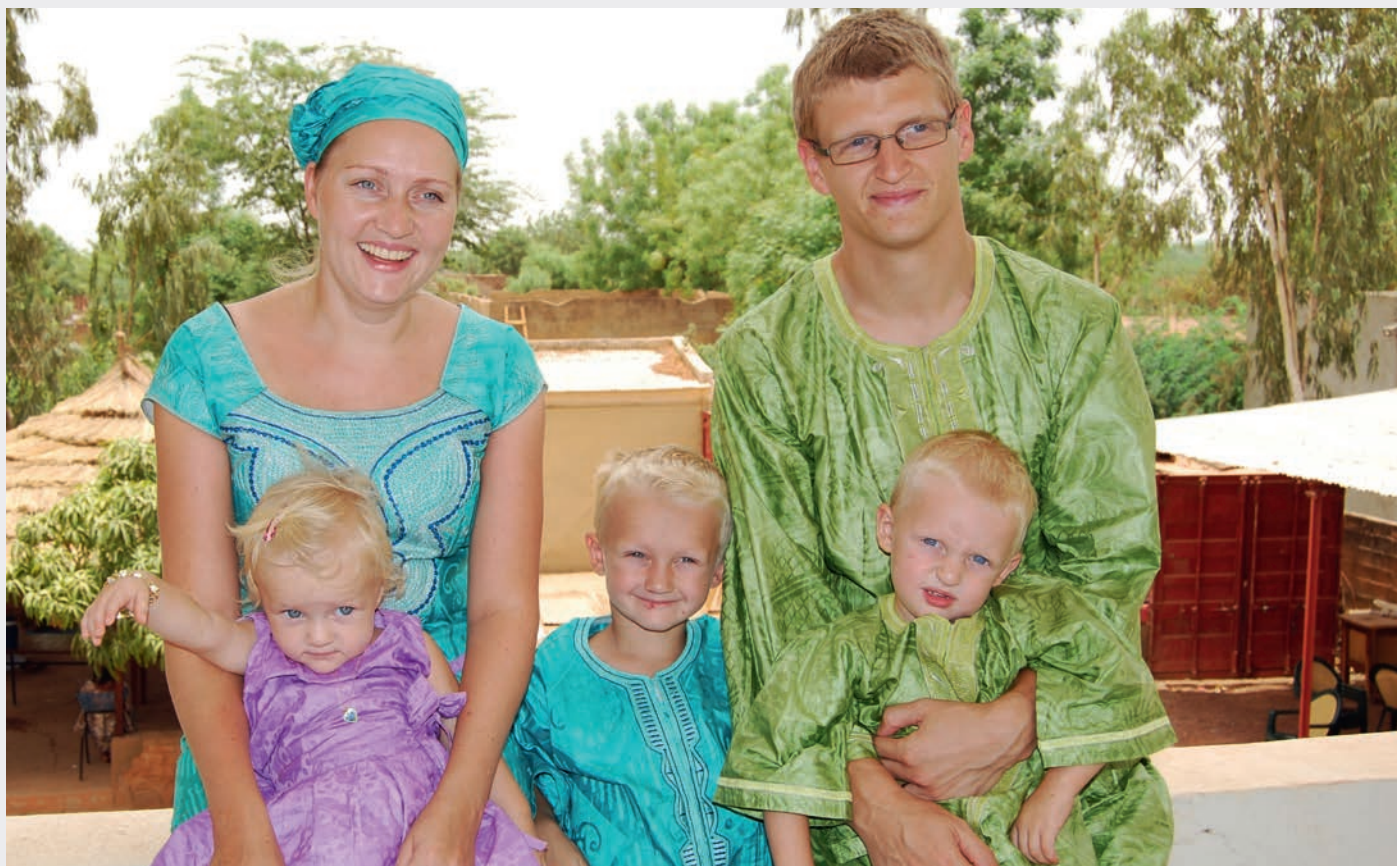
Familien Monger flyttet til Mali i 2010, uten noe fast tidsperspektiv på hvor lenge de skulle være der. Men oppholdet ble kortere enn forventet.

– Jeg var mer enn kvalifisert til å være bibeloversetter. Jeg hadde til og med meldt meg opp til et kurs i fulani semesteret etterpå. Og det var jo det de ville ha meg som bibeloversetter til. Så jeg forsto fort at dette var meningen.