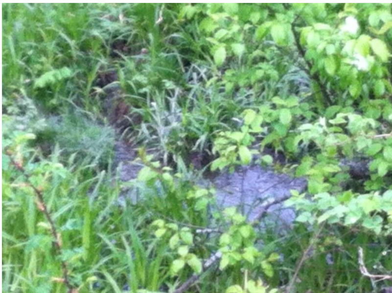
Bilde av Olavskilden i nærheten av Veiabekken i Nedre Eiker-mai 2015

Min konklusjon må derfor bli, på bakgrunn av alt materiale jeg har studert, at det er mulig at kilden i Nedre Eiker er en Olavskilde.