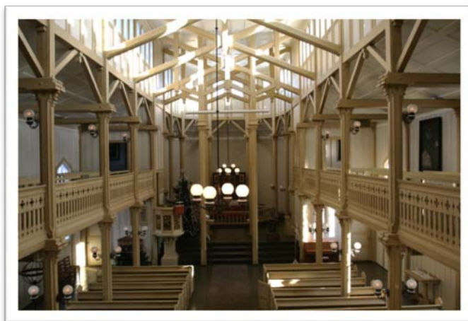
Gjerstad kirke.

Det var ingen i Gjerstad eller omegn som hadde kunnskaper om oppføring av bygninger i bindingsverk. Dermed ble snekker Lars Rasmusen Listøl med John Aas til Christiania. Han konstruerte en modell av kirken under oppsyn av Grosch, men likevel ble han ikke trygg nok til å ta på seg byggeoppdraget. Det var byggmester Jensen fra Kragerø som til slutt fikk oppdraget. 137 På grunn av varierende kunnskaper blant byggmestre og viljen til å lese byggetegninger, kunne det dukke opp mange lokale løsninger under byggingen av kirkene. En ferdig oppført kirke kunne dermed ha store avvik fra den opprinnelige tegningen. Men når det gjelder Gjerstad kirke, ble den antagelig oppført nøyaktig etter tegningene. 138