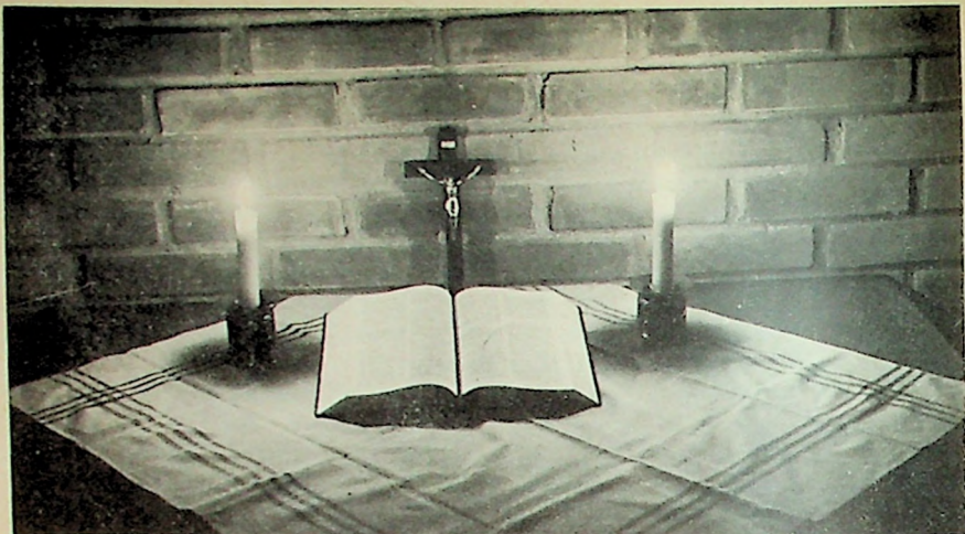
«Guds ord det er vårt arvegods»