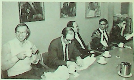
Glimt fra lærerkaffen.