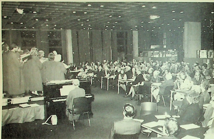
MF-koret sang for en fullsatt festsal — 7. november.