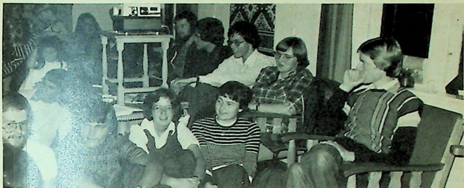
Hyggekveld på Asly leirskole i Hurum under week-end for nye studenter.