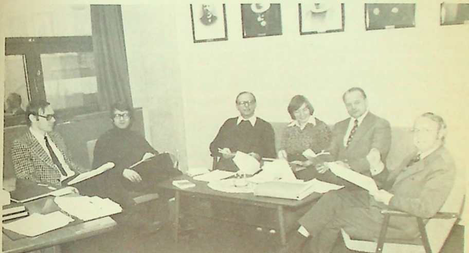
Kateketseminarkomiteen i arbeid.

Dermed er det klart at kateketutdannelsen kan starte fra høsten 1977 slik som forutsatt i Forstanderskapets vedtak av 26. april 1976.