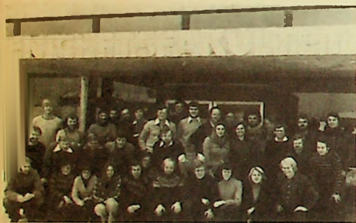
En del av Sørlandsstudentene samlet utenfor MF.