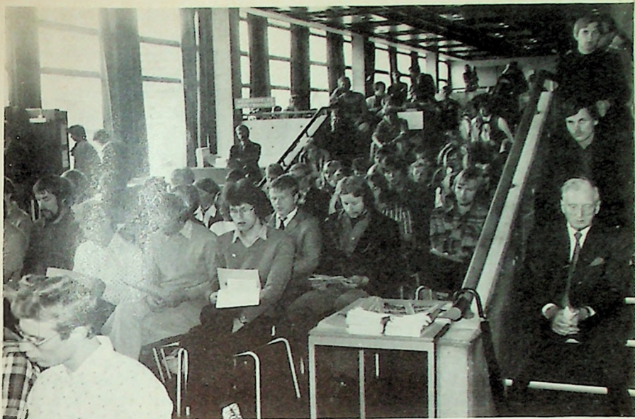
Trangt om plassen ved semesteråpningen fredag 1. september.

Utsnitt av forsamlingen bakerst i festsalen.