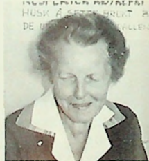
Asne Rønning Kantinen