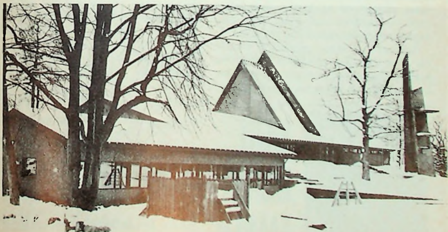
Jeløy kirke, innviet 27. april 1975.