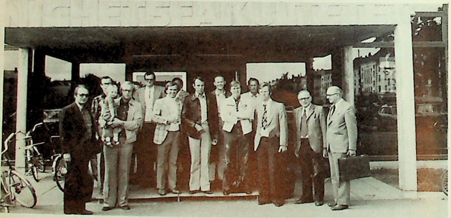
Prester fra hele landet på etterutdanningskurs juni 1978. Her en del av dem samlet foran inngangen på MF.