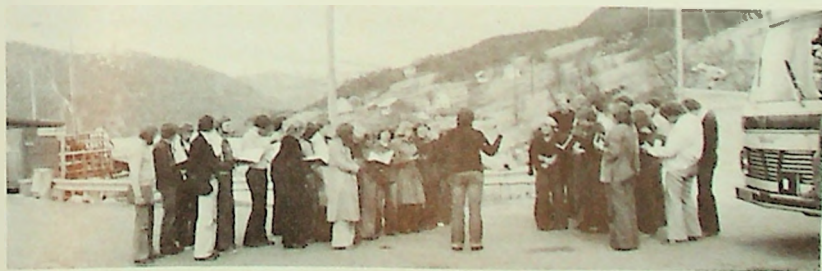
Fra MF-korets turné til Nord-Norge i 1977.

Overnattningen blir ordnet privat, unntatt nettene 7.—8. og 13—14. da koret bor på Bursdalsheimen.