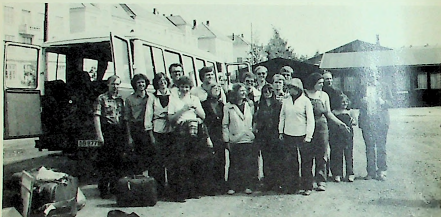
Bildet viser avreisen fra MF for korgruppen 9. juni.