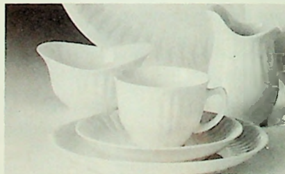
Porselensservice - modell «Spire».

Det er skrevet brev til alle MF-foreningene om messene, og foreningene i Oslo-området er oppfordret til