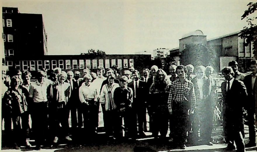
MF-lærere og studenter klar til innsats i Østfold.