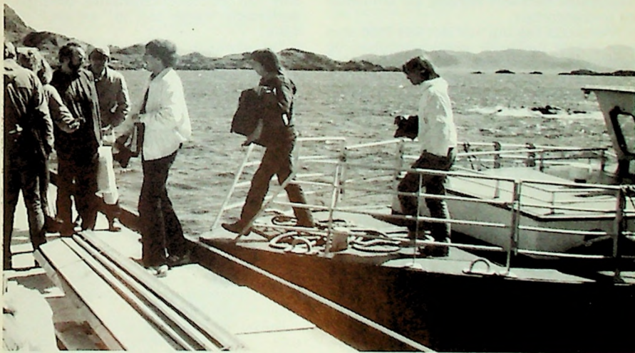
Fra MF-korets turné juni 1982 (Se også «Takk frå MF-koret» på side 31.)

Psykiater har hatt ialt 130 samtaler fordelt på 22 studenter (5,9 samtaler pr. student). De fleste av disse kontaktene er formidlet gjennom den øvrige omsorgstjenesten, men noen har også henvendt seg direkte.