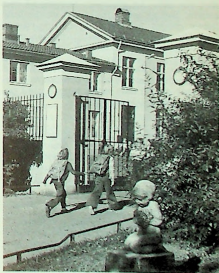
Bildet er fra Ullevål skole i Oslo.