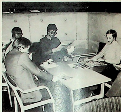
Under pausene i lesningen er det fint å kunne slappe av i avisrommet. Studentene har selv kjøpt nye møbler.