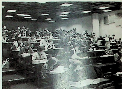
Fra auditorium 1.

Til sist betyr det at vi prøver å legge opp et studium der de praktiske sider stadig skal få belyse teorien. Teologi kan lett bli et teoretisk fag – uten den nødvendige bakkekontakt. MF prøver å redusere den faren ved bevisst å peke på at teologi skal fungere i en praktisk sammenheng: For-