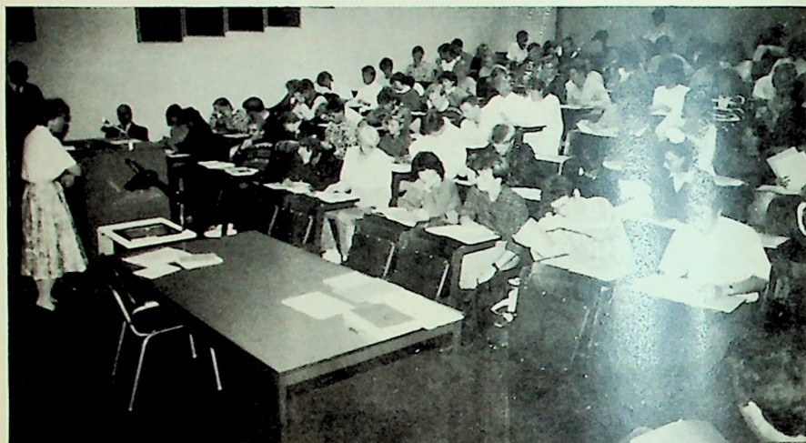
Glimt fra innføringskurset for nye studenter ved Det Teologiske Menighetsfakultet høsten 1987.