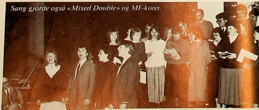
Sang gjorde også «Mixed Double» og MF-koret.