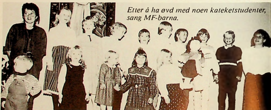
Etter å ha øvd med noen kateketstudenter, sang MF-barna.