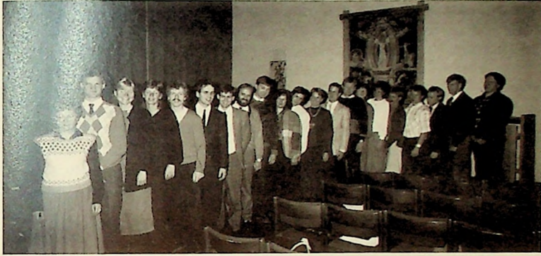
Kandidatene i MFs kapell (i alfabetisk orden)