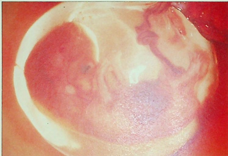
Menighetsfakultetets lærere mener at bruk av fostervev vil etablere en medisinsk praksis som forutsetter en stadig tilgang på aborterte fostre.

Man ser at bruk av fostervev i medisinsk behandling vil kunne hjelpe noen, selv om det fortsatt er usikkert hvilke helsemessige gevinster en virkelig oppnår på denne måten. Men disse godene vil en oppnå ved en praksis som man er enig om å stemple som et onde. Å anvende celler og vev fra fostre vil også kunne bidra til å gjøre provosert abort til et mindre onde for den allmenne opinionen enn når