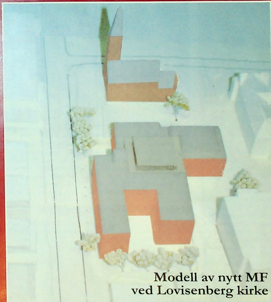
Modell av nytt MF ved Lovisenberg kirke

Utgitt av Det teologiske Menighetsfakultet • Nr. 5, 1996 • 61 årg.