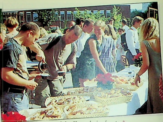
Populært med kaffe og kringle ute ▲

Nydelig vær, gudstjeneste og kirkecaffe ute i det fri ved semesteråpningen i august.