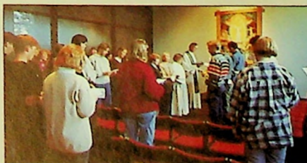
◀ Dagen ble avsluttet med kveldebonn i kapellet, hvor Praktikum hadde ansvaret.