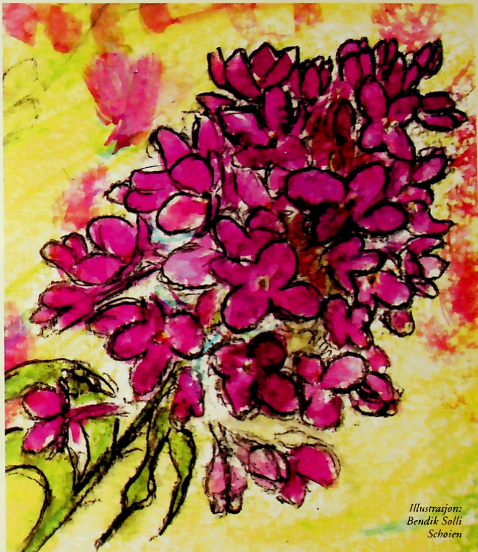
Illustrasjon: Bendik Solli Schoien

Legg merke til godheten og kjærligheten. Det er heldigvis mye kjærlighet, raushet og godhet. Det står ikke så ofte om det i avisene, men det er der. Se på kvinnen som tar med seg blomster til de syke i menigheten. Se på faren som lærer barnet sitt å sykle. Kjærligheten og godheten gir styrke og håp i hver-