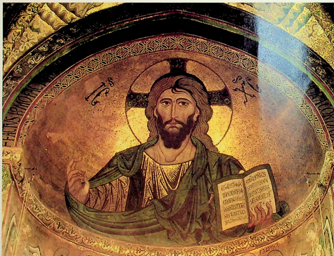
Illustrasjon: Kristus Pantokrator, mosaikkbilde fra katedralen i Cefalù på Sicilia, fra 1148.

Det er i virkeligheten det første studiet i sitt slag i Norge. Til høsten braker det løs med denne nyskapingen ved MF.