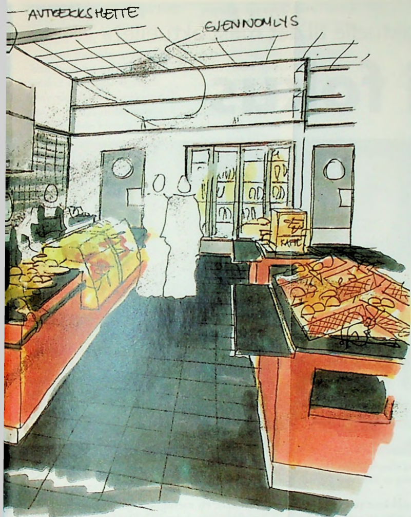
Skisse av serveringsdisken i den nye kantina, slik arkitekten ser den for seg.