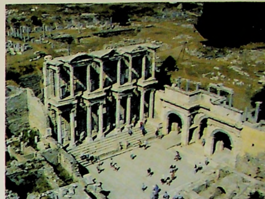
Utsnitt fra gamle Efesus, med handelstorget og Celsos-biblioteket.