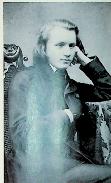
Johannes Brahms, fotografert rundt 1856.