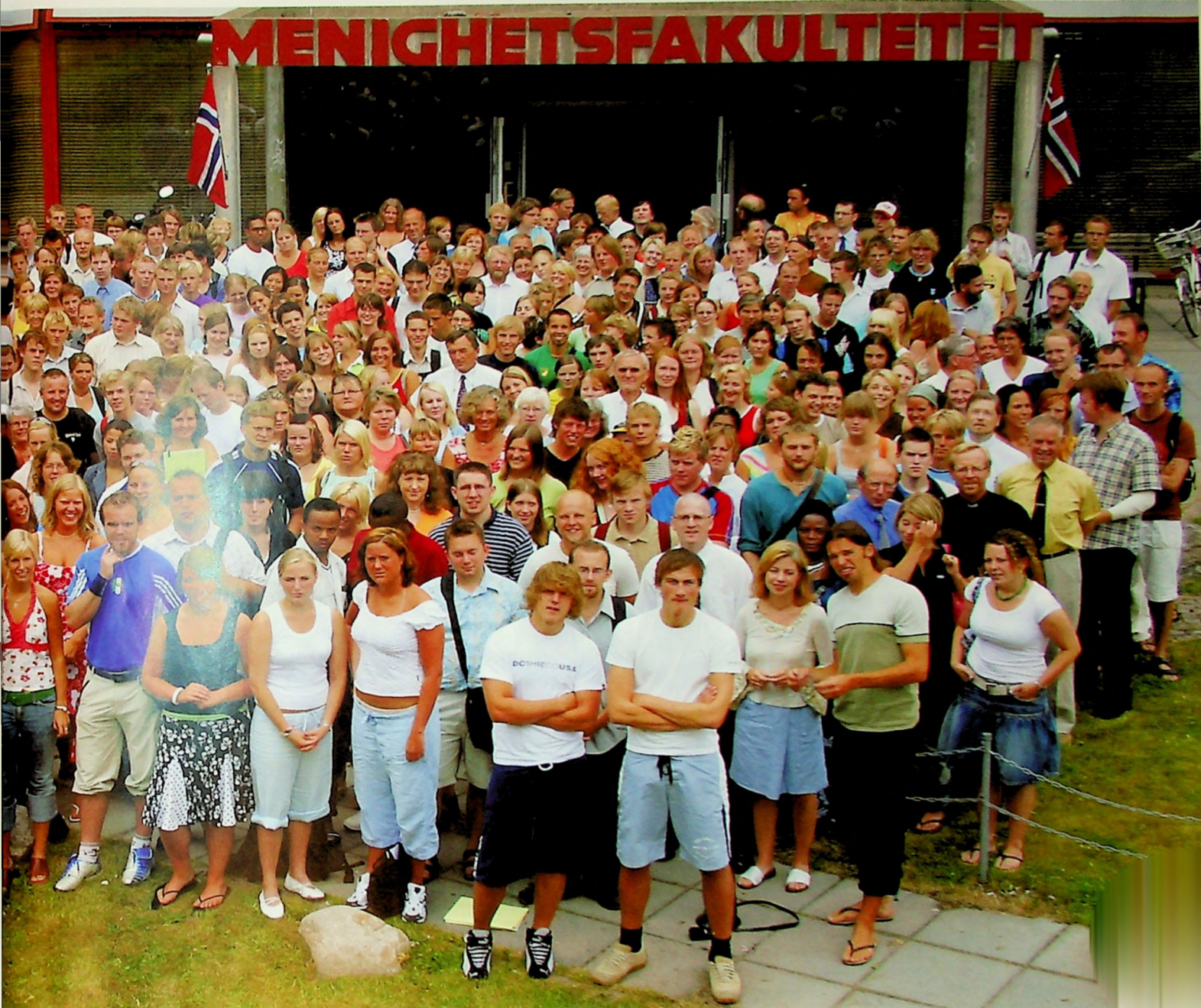
En del av de nye MF-studentene deltok under semesteråpningen 11. august. Her fotografert utenfor MF-bygget i Gydals vei 4.