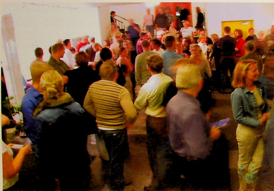
Illustrasjonsfoto fra Filadelfiamenigheten i Oslo.

Menighetsfakultetet ønsker å styrke sin kompetanse i pentekostal teologi og innleder et samarbeid med pinsebevegelsen i Norge om studiemoduler i pentekostal spiritualitet og lederskap.