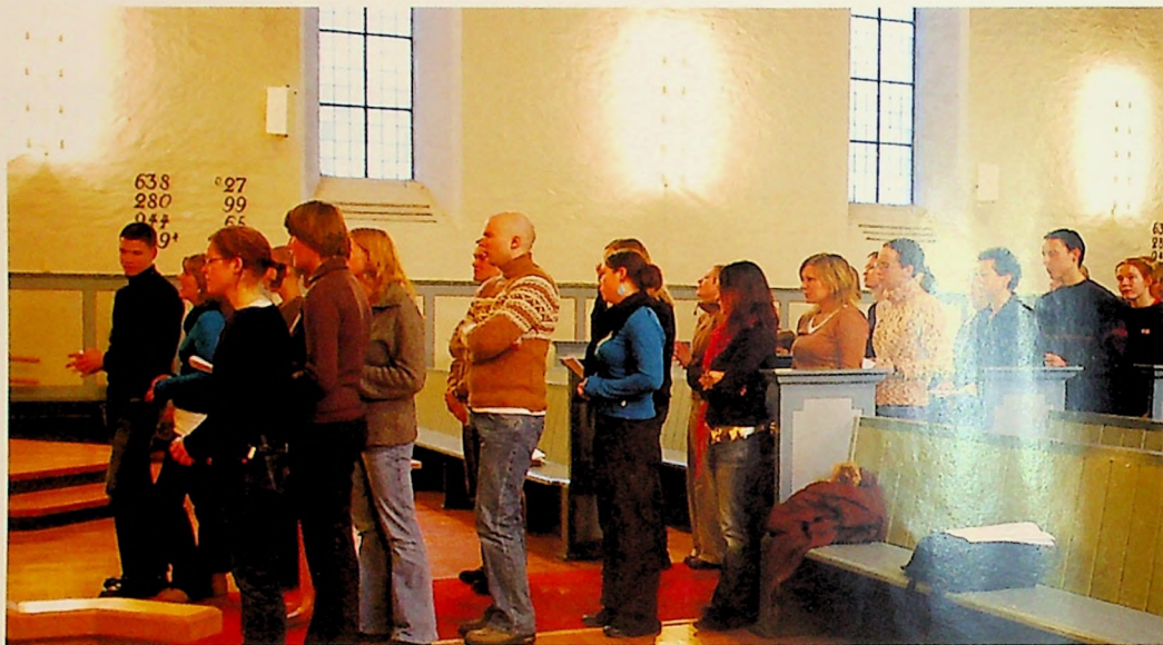
Det var lang kø fram mot nattverdsbordet i Masjorstua kirke under semesteråpningen 13. januar.