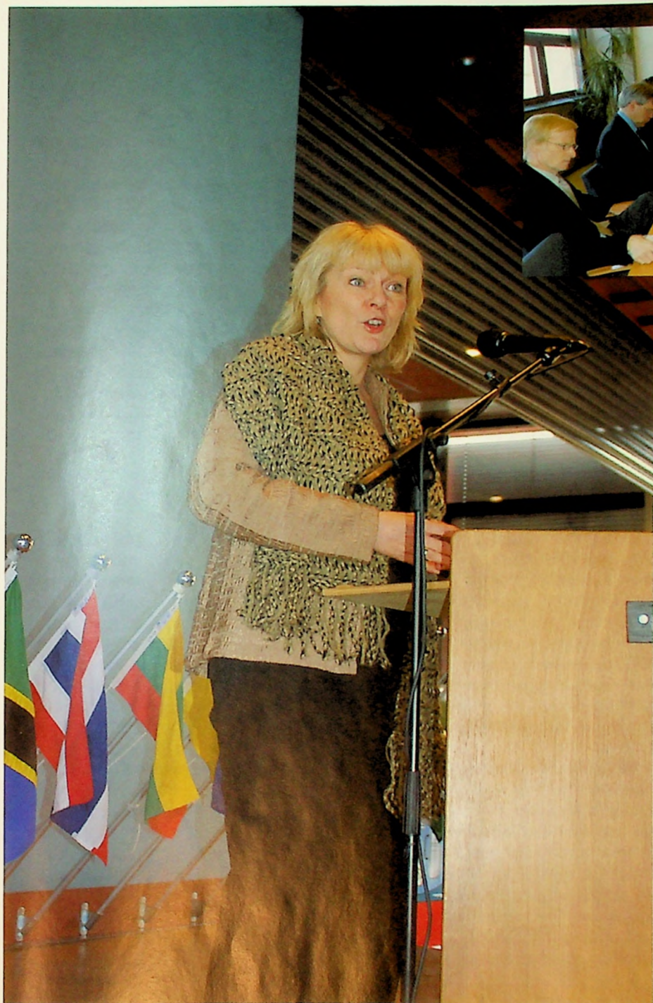
Statsråd Kristin Clemet tok seg god tid til å svare på spørsmål fra MF-studentene, som bl.a. dreide seg om studiefinansiering, KRL-fagets framtid og hvordan høyere utdanning skulle klare å ta imot en stadig større andel av unge studenter fra videregående skole.