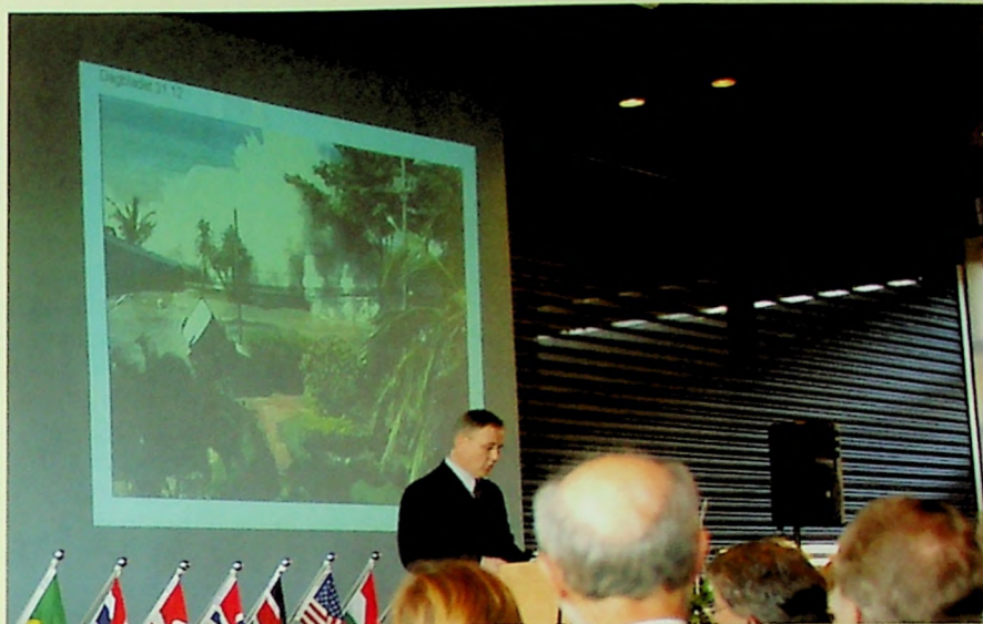
Under semesteråpningen 13. januar holdt professor Terje Stordalen en forelesning om «Tsunami og teologi - refleksjoner fra utsiden av Noahs ark».