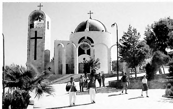
Den syrisk-ortodokse kirkes nydelige kapellområde ved det som holdes for kallelse- og omvendelsesstedet til Paulus, et par mil syd for Damaskus.