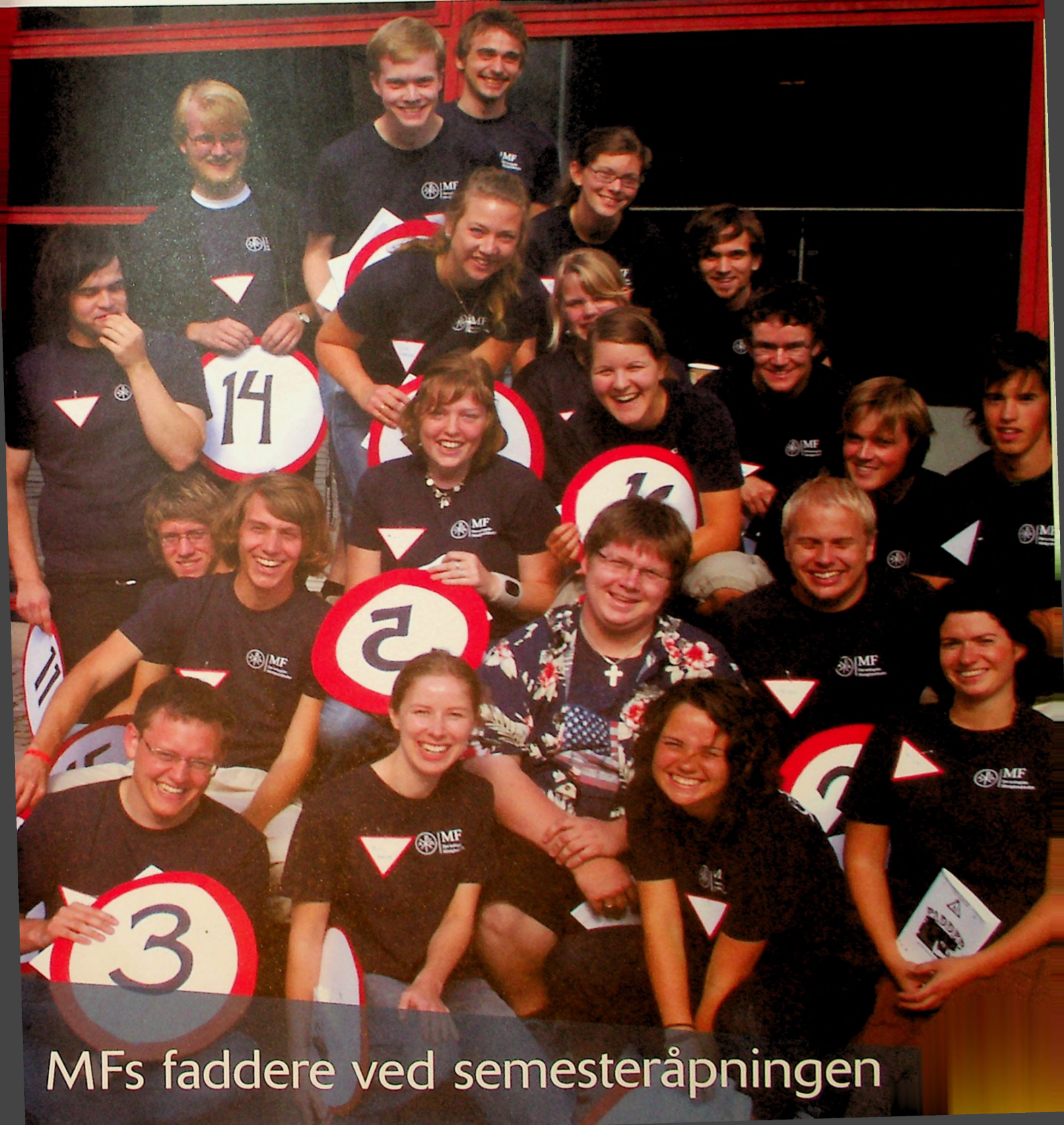
MFs faddere ved semesteråpningen

Informasjonsblad for Menighetsfakultetet Nr. 4, september 2007 73. årgang