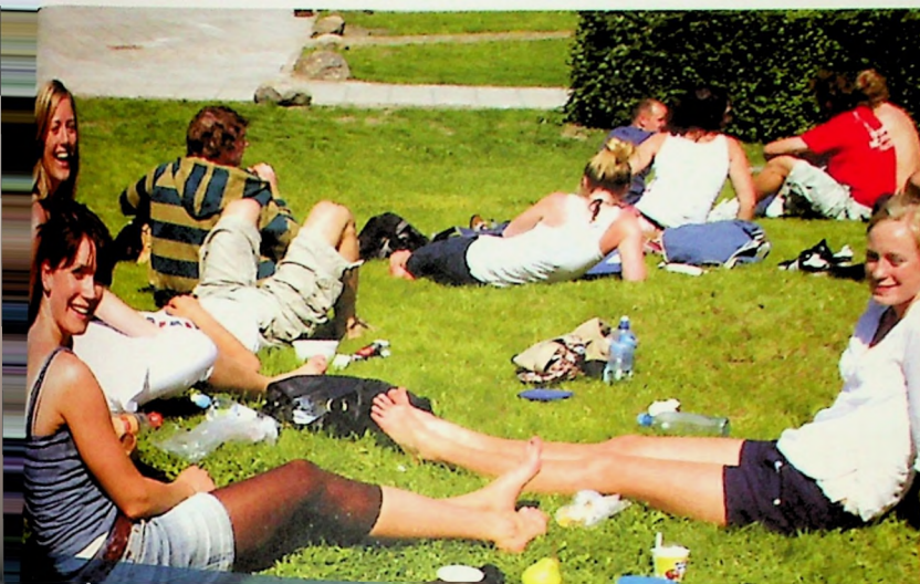
OMRÅDET mellom Musikkhøyskolen og MF har vært en byggeplass i lang tid. Nå er endelig de grønne og trivelige områdene i orden igjen og studentene nyter sommeren.