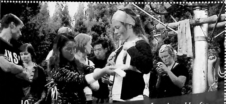
Ine gjøres klar for en luftig tur på løypestreng.