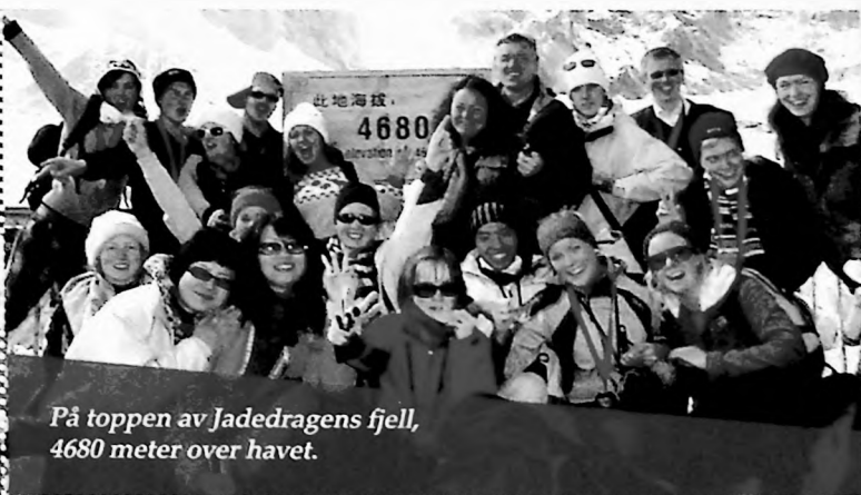
På toppen av Jadedragens fjell, 4680 meter over havet.