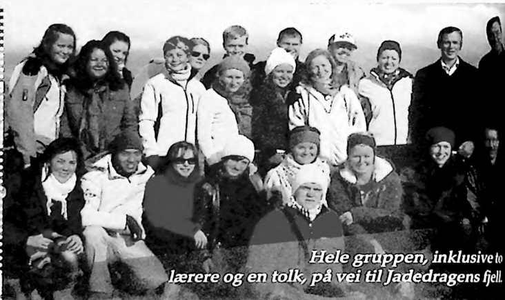
Hele gruppen, inklusive to lærere og en tolk, på vei til Jadedragens fjell.