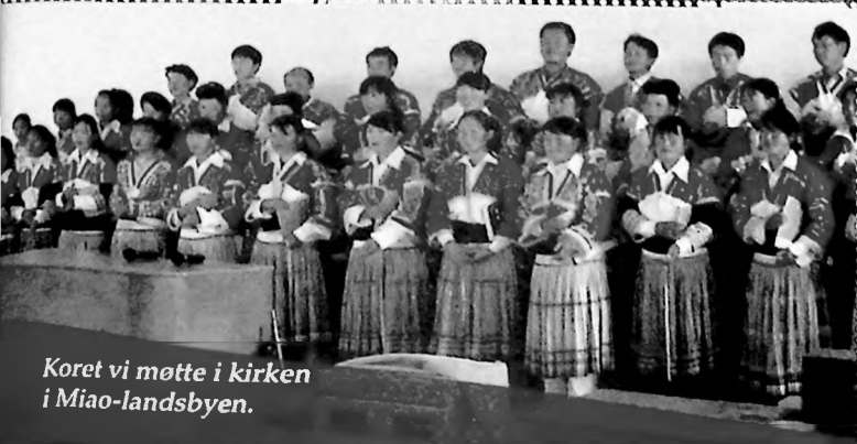
Koret vi møtte i kirken i Miao-landsbyen.