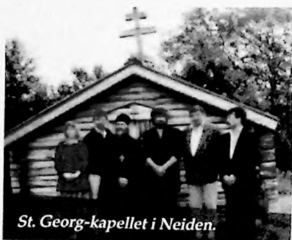
St. Georg-kapellet i Neiden.

– Det var en utfordring å skrive en faglig avhandling der jeg hadde så lite skriftlig materiale å arbeide med, men desto flere muntlige sagntradisjoner. Ett av