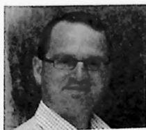
TEKST: JOHN KAUFMAN

Noen få steder skriver han at vi skal bli "guder", med henvisning til Salme 82, og han skriver mye om at vi skal bli "lik Gud" og at vi skal få del i Guds ånd og egenskaper. Guddommeliggjørelsesmotivene er uten tvil viktige for Irenaeus, særlig de to siste. Likevel konkluderer jeg med at han ikke forfekter noen helhetlig lære om menneskets guddommeliggjørelse. For Irenaeus er disse motivene alltid forbundet med det å være fullt og helt menneske av kjøtt og blod. Det er derfor mer i tråd med Irenaeus' egen teologi å presentere menneskets mål som dets fullkomne modenhet som menneske. For Irenaeus var menneskets mål aldri at det skulle bli noe annet eller noe mer enn menneske, at det skulle overstige sin menneskelige natur og bli "guddommelig". Vi mennesker ble skapt i Guds bilde, og helt fra skapelsen av har målet vært at vi skal få del i evig liv og få del i Guds ånd, slik at vi kan vokse i likhet med Kristus—det er dette som er fullkommen menneskelig modenhet. Guddommeliggjørelsesmotivene er tilstede hos Irenaeus, men de inngår i en lære om menneskelig modenhet, ikke i en lære om guddommeliggjørelse.