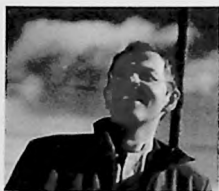
TEKST: HALLVARD OLAVSON MOSDØL ILLUSTRASJON: ANNE REE

Boka er herved anbefalt. Gjerne i engelsk utgave m/orange markeringstusj.