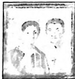
Bild 3 i Forskningsprosjektet ved Det teologiske Menighetsfakultet